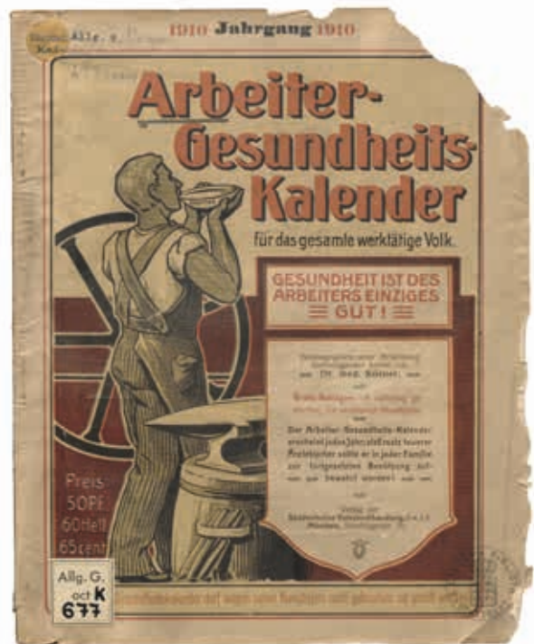
Arbeiter-Gesundheitskalender 1910 (WLB, Allg.G.oct.K.677).

Der Arbeiter-Gesundheitskalender aus dem Jahr 1910 stellt im Kalendarium Informationen über die Verhütung einer Ansteckung mit Tuberkulose in den Vordergrund. Die Lungentuberkulose war in dieser Zeit die häufigste Todesursache, die Arbeiterschaft war aufgrund von Armut und beengten Wohnverhältnissen besonders betroffen. Es war bereits bekannt, dass es sich bei Tuberkulose um eine Infektionskrankheit handelt. Der bakterielle Erreger dieser Krankheit war von Robert Koch entdeckt worden, ein wirksames Heilmittel gab es jedoch noch nicht. Aufklärung über die Bedeutung hygienischen Verhaltens zur Vermeidung einer Infektion war deshalb besonders wichtig. Aber auch die Problematik des Alko-