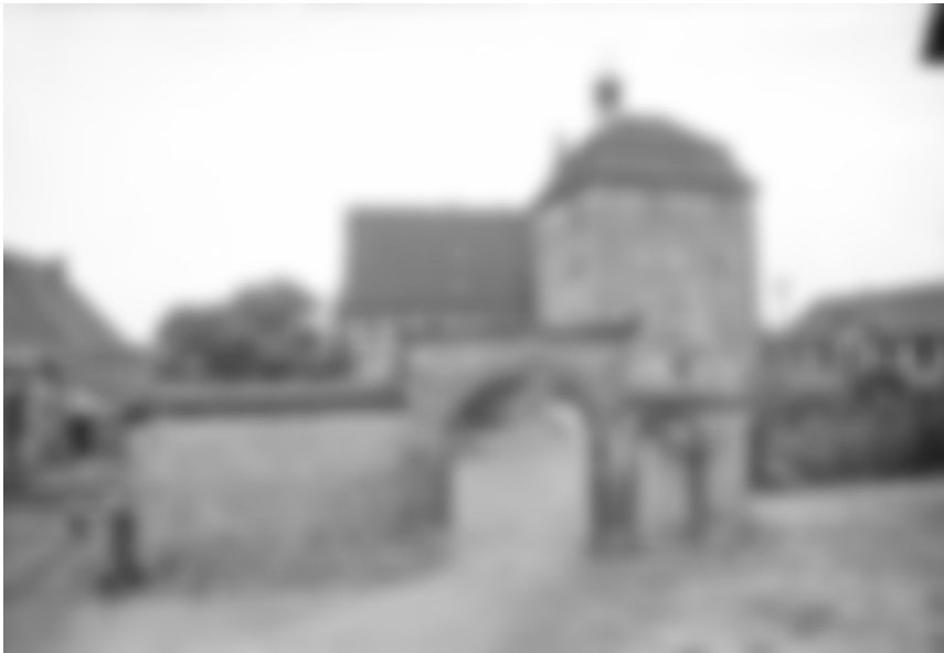
Abb. 3: Das Oßweiler Schloss, von 1646 bis 1748 im Besitz der Familie Bidembach von Treuenfels (oben: Westansicht des Schlosses – unten: Blick vom Schloss auf den Schlossgarten).