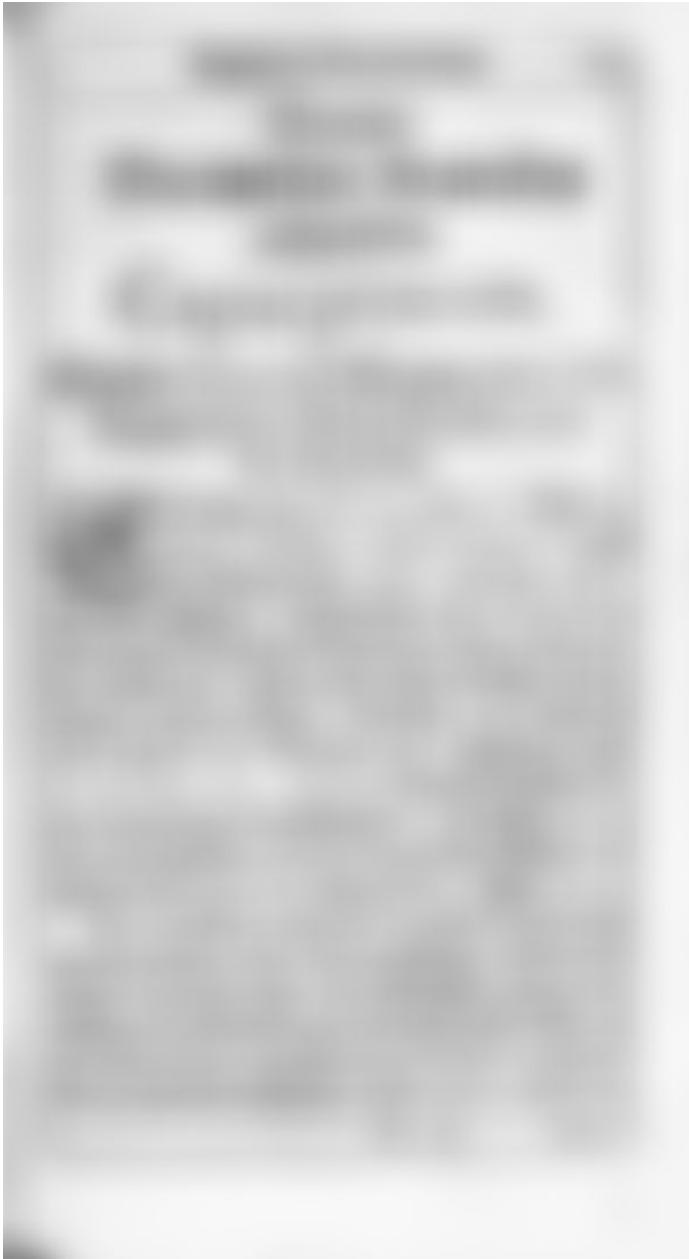
Abb. 9: Ein Kapitelbeginn aus vorgeanntem Lehrbuch für angehende Kirchendiener.