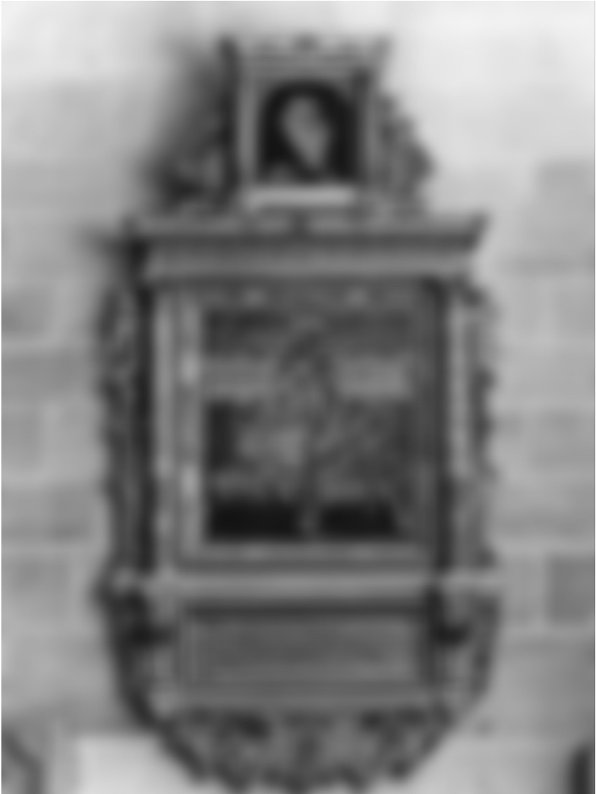
Abb. 1: Das Epitaph Eberhard Bidembachs im Kloster Bebenhausen.