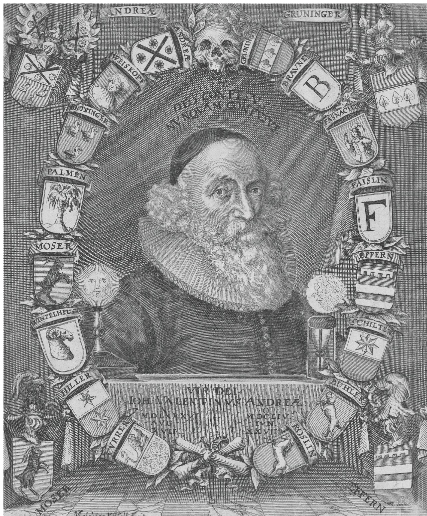
Abb. 4: Porträt Johann Valentin Andreaes unter seinem Denkspruch Deo confisus nunquam confusus (vgl. Ps 71, 1) aus der Werkstatt des Augsburger Stechers Melchior Küsell. Das Porträt wird von einer Wappenprobe der Familien Andreae und Grüninger umgeben.