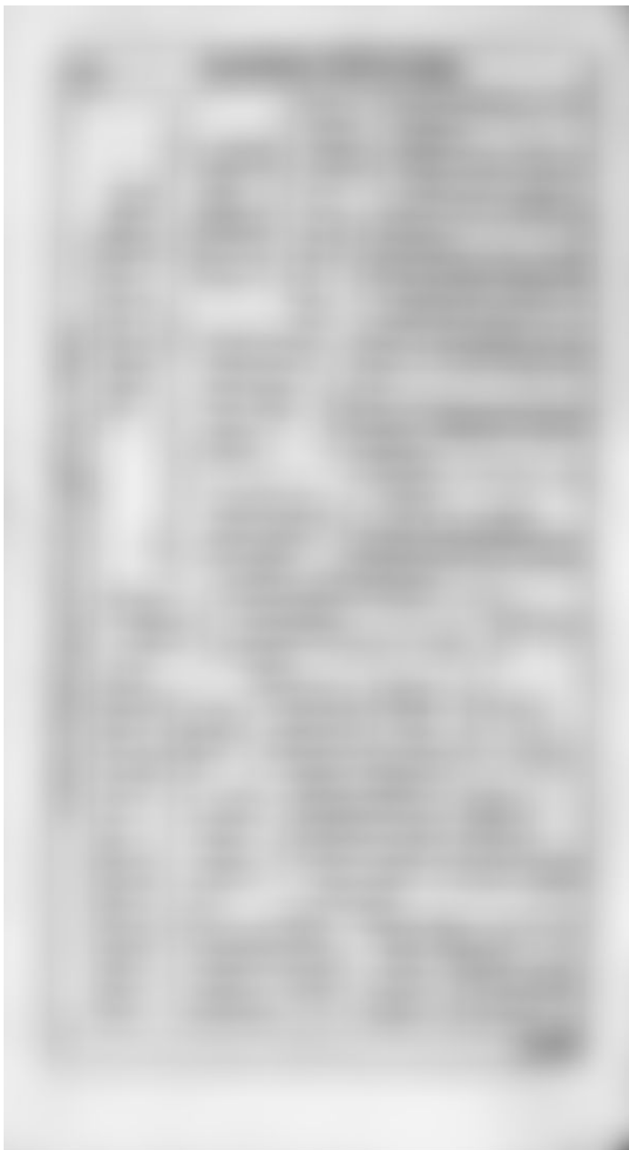
Abb. 8: Tabella synoptica aus dem „Manuale ministrorum ecclesiae“ von Felix Bidembach, Tübingen 1603.