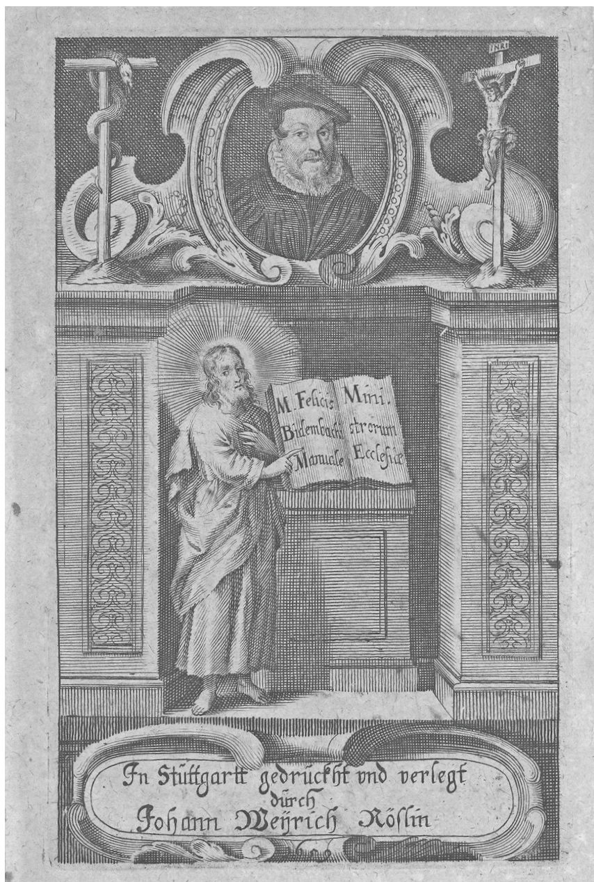
Abb. 10: Porträt des Prälaten Felix Bidembach (1564–1612) auf dem Frontispiz des „Manuale ministrorum ecclesiae“ der Ausgabe Stuttgart 1659.