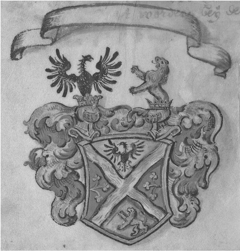
Abb. 2: Wappen der Familie Bidembach von Treuenfels. Unnd zu mehrer gezeugnus und gedechtnus solcher erhebung in den standt unnd gradt deß adels, haben Wir Ihne, seinen Ehelichen Leibs Erben unnd derselben Erbens Erben Manns: und Weibs Persohnen hernach folgendt adelich Wappen unnd Cleinoth alß zuführen und zugebrauchen gnediglich erlaubt unnd gegönnet, Alß mit nahmen sein von beeden ndern biß oben beeden eckhen creuzweiß über ein ander geschrenckhte Wasserflüß in vier theil alß abgetheilte Schildt, daß das under theil blau oder lasurfarb, darinnen für sich ein gelb oder goldfarben Löw, mit offenem rachen, roth außgeschlagener Zungen, für sich geworffnen Pranckhen und über sich gewundenen schwanz, ober theil gelb, darinnen erscheint ein schwarzer außgebräuter einfacher Adler, mit offenem Schnabel und roth außgeschlagener Zunge, übrige beede theil oder seitten winkhl aber roth oder rubinfarb, in jedem drey gelbe drey blattelte an ein and[er] gehankhte kleeblatter, auff dem Schildt zwey freye offne adeliche: deren dero hindere mit einer heidnischen: vordere aber einer königliche Cron gezierte und gegen einandt gekehrte Turniershelm, zuer linckehn mit blau: rechten: roth und alß beedseits gelber helmdeckhen geziert, auß der hindern: für sich einwehrts ein vordertheil deß ein Schildt beschriebenen gelben Löwens, auß der vordern Cron biß ohne die Waffen unnd schwanz, der außgebräutte schwarze Adler mit offenem Schnabel unnd roth außgeschlagener Zungen erscheinend [...]. ÖStA, RA 944, 5r–v.