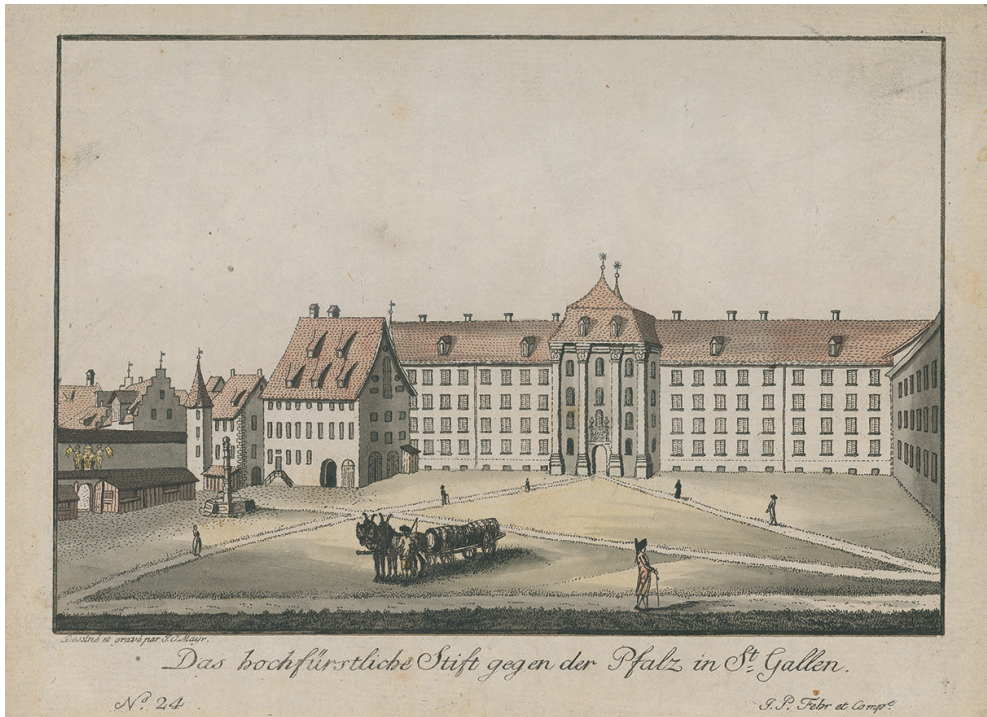
Abb. 1: Die barocke Neue Pfalz in St.Gallen bildet das politische Machtzentrum St.Gallens – zunächst des Klosterstaates und anschließend des Kantons. Im Mittelrisalit tagt das kantonale Parlament.

Zürich oder Luzern vergleichen. Die st.gallischen Staatsarchivbestände dokumentieren dementsprechend vor allem die kantonale Historie seit Beginn des 19. Jahrhunderts. Durch diese zeitliche Eingrenzung und die bewährte Öffentlichkeitsarbeit der beiden eben genannten Einrichtungen steht das Staatsarchiv meist nicht in der ersten Reihe der (populären) Geschichtsvermittlung. Darüber hinaus gilt, dass sich der Geschichtsbetrieb einerseits im hauptstädtischen Umfeld konzentriert, oder aber er ist andererseits auf einzelne Regionen hin ausgerichtet. Der ringförmige Kanton St.Gallen, aus Gebieten zusammengesetzt, die bis 1803 teilweise nicht viel gemein hatten, ist für viele seiner Einwohnerinnen und Einwohner bis heute eine bisweilen abstrakte Größe geblieben. Das alles trägt mit dazu bei, dass das Staatsarchiv sich eine eigene Nische suchen respektive ein eigenständiges Profil entwickeln musste und muss – quasi in Abgrenzung gegenüber mitbewerben- den Archiv- und Kultureinrichtungen. Nicht zuletzt deswegen stellte die Institution in den vergangenen 20 Jahren ihre Funktion für Demokratie und Rechtsstaat in den Vordergrund. Dann kümmerte sie sich besonders um Fragen der digitalen Sicherung, der elektronischen Erschließung