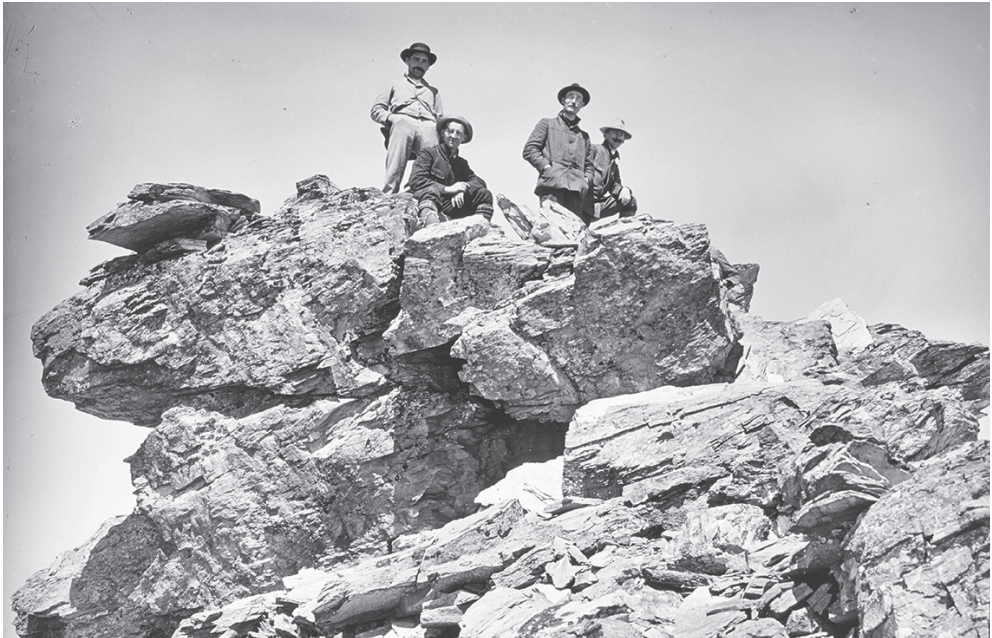
Abb. 4: Gipfelstürmen ist Teamarbeit. Bergsteiger auf dem Ringelspitz, dem höchsten Berg des Kantons St.Gallen (3247 Meter über Meer).