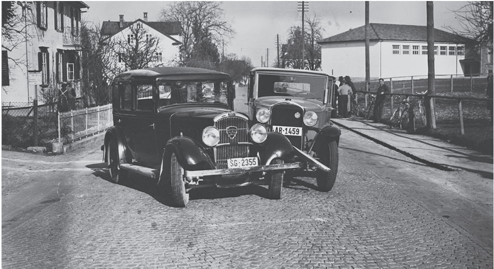
Abb. 3: Unfälle sind leider unvermeidlich – nicht nur im Straßenverkehr.

Bewertungsprozess zu entwickeln und anschließend zu etablieren. Baden-Württemberg mit seiner horizontalen und vertikalen Bewertung wurde für uns in diesem Bereich zum bestimmenden Vorbild.