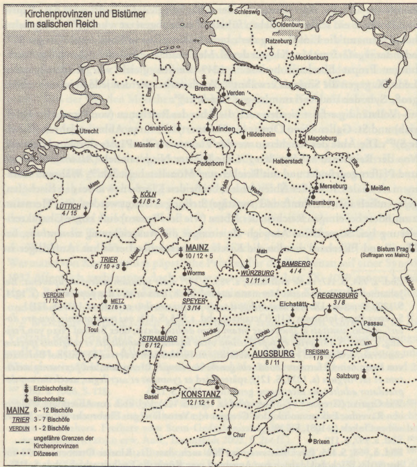
Abb. 7: Kirchenprovinzen und Bistümer im salischen Reich.

Aus: Stefan WEINFURTER, Herrschaft und Reich der Salier. Grundlinien einer Umbruchzeit, Sigmaringen 1991, S. 29 Abb. 3, bearbeitet von Ann-Mailin Behm.