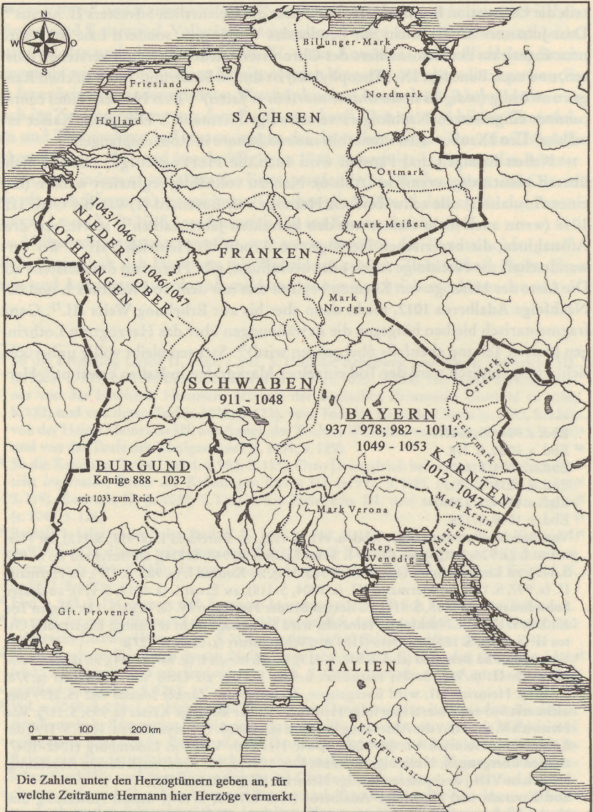
Abb. 6: Die Herzogtümer im hochmittelalterlichen Reich. Aus: Das Reich der Salier 1024–1125, Sigmaringen 1992, S. 8, bearbeitet von Ann-Malin Behm.