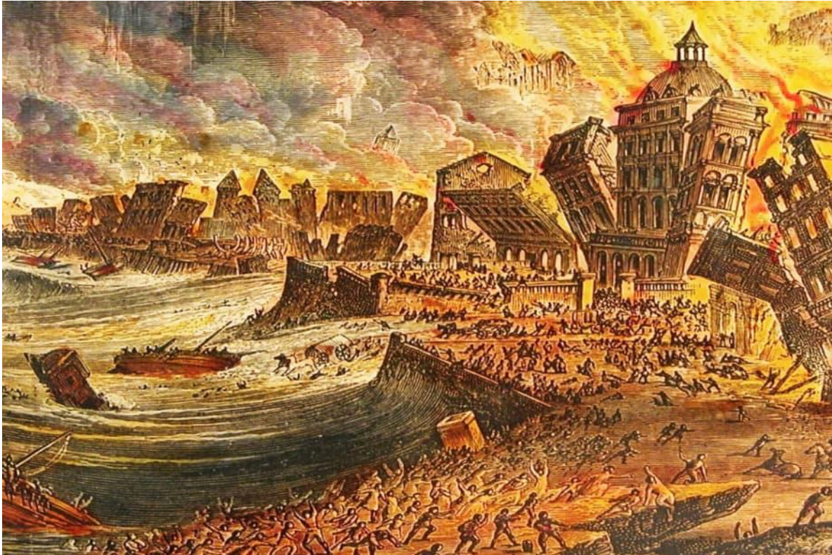
Ein Naturereignis erschüttert das religiöse Weltbild: Das Erdbeben von Lissabon 1755