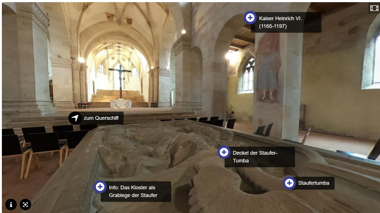
Abbildung 1: Das Innere der Klosterkirche (Mittelschiff); versehen mit Sprungmarken und interaktiven Informationselementen