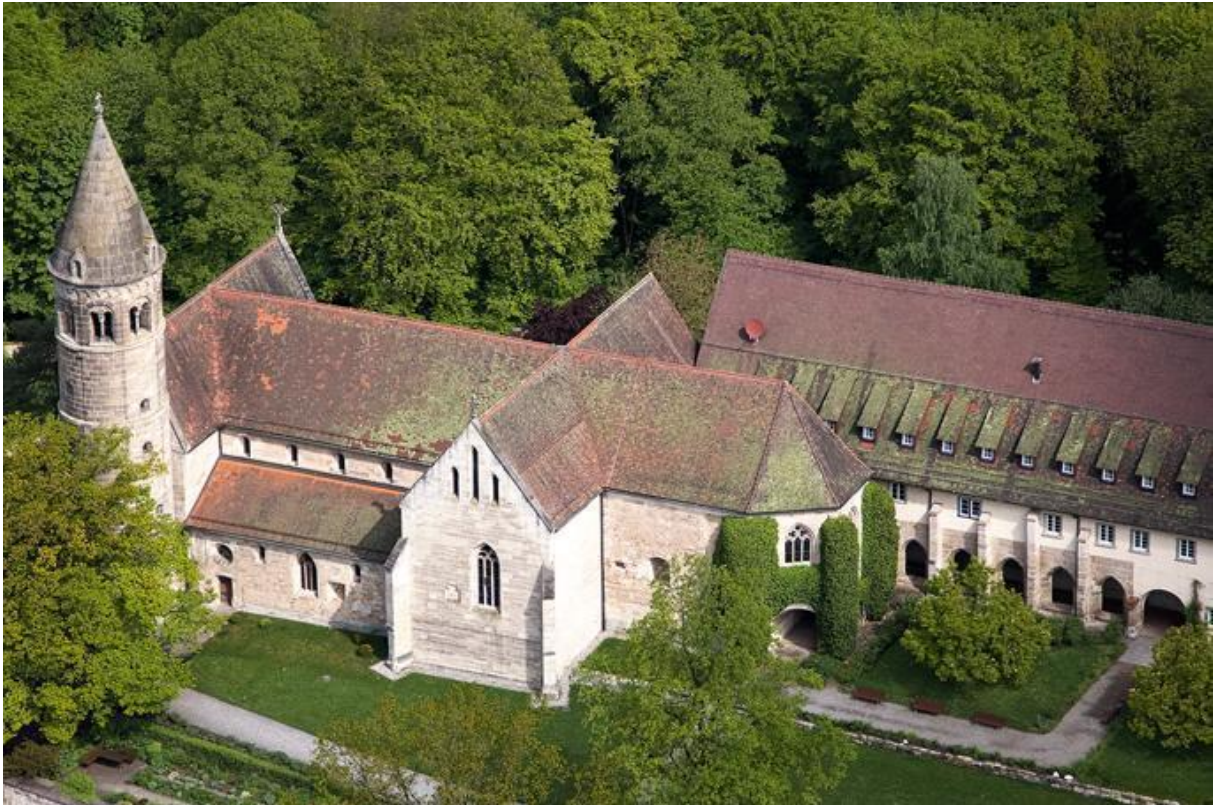
Abbildung 5: Kloster Lorch, Kirche und Kreuzgangsbereich

Bezüglich einer möglichen Nutzung des digitalen Moduls „Kloster Lorch 360°“ können sich interessierte Geschichtslehrkräfte des Landes Baden-Württemberg per Mail an landeskunde@zsl-bw.de wenden.