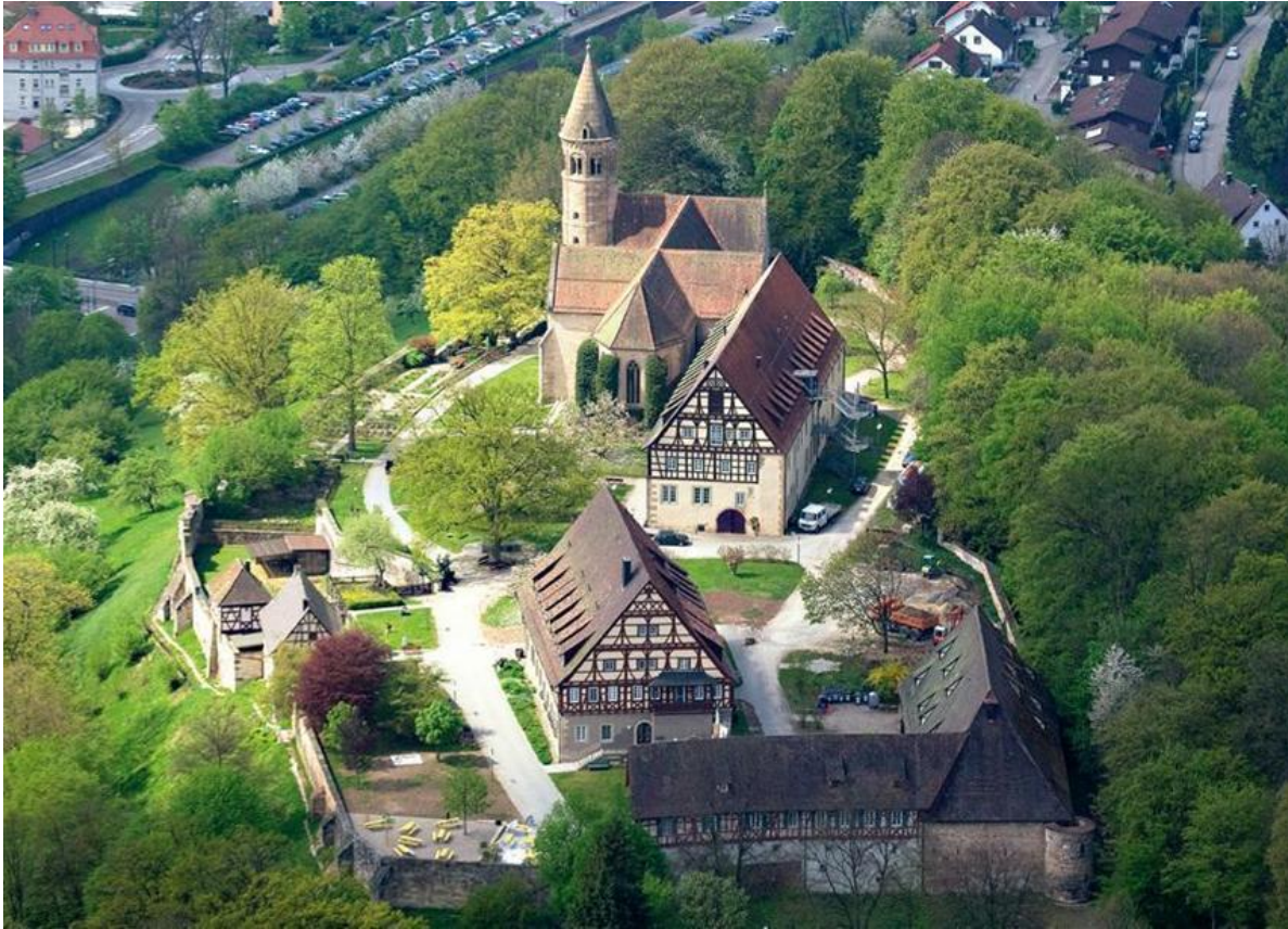
Abbildung 4: Kloster Lorch, Gesamtanlage