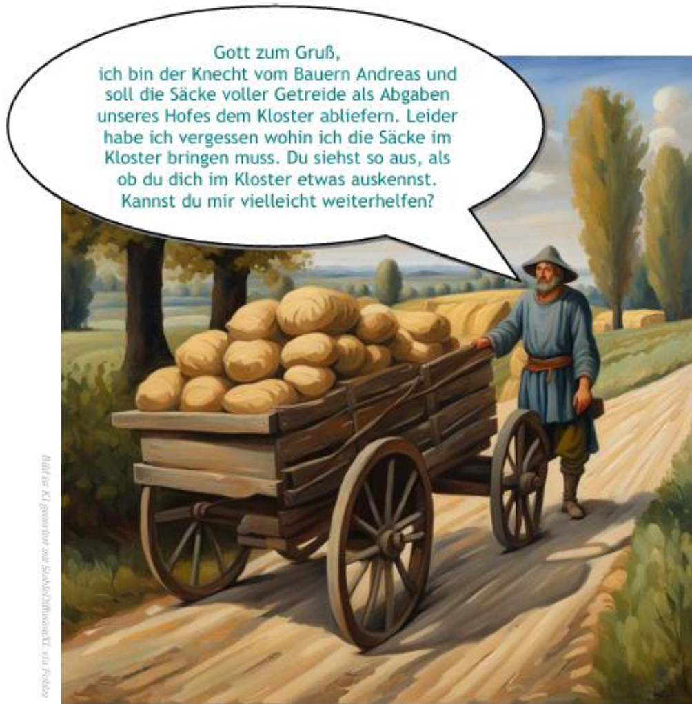
Abbildung 3: Ablieferung von Abgaben