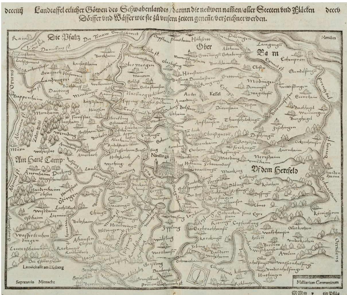
Abb. 1: StAN, Sebastian MÜNSTER: Cosmographiey Oder beschreibung Aller Länder herrschafftten vnd fürnemsten Stetten des gantzen Erdbodens, sampt jhren Gelegenheiten, Eigenschafftten, Religion, Gebreuchen, Geschichten vnnnd Handtierungen, etc. Basel 1588

Netzwerkarbeiten sowie Internetoptionen große Chancen, um notwendige Fachkenntnisse zu erlangen und auszutauschen. 18