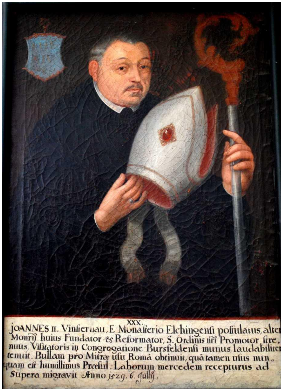
Abb. 3: Abt Johann II. Vinsternau, Kloster Neresheim: Konventbau

Übergriffen ausgesetzt zu sein, war offenbar groß, denn nach der Erlaubnis, das Kloster zu verlassen, verblieben offenbar nur zwei Patres vor Ort. 47