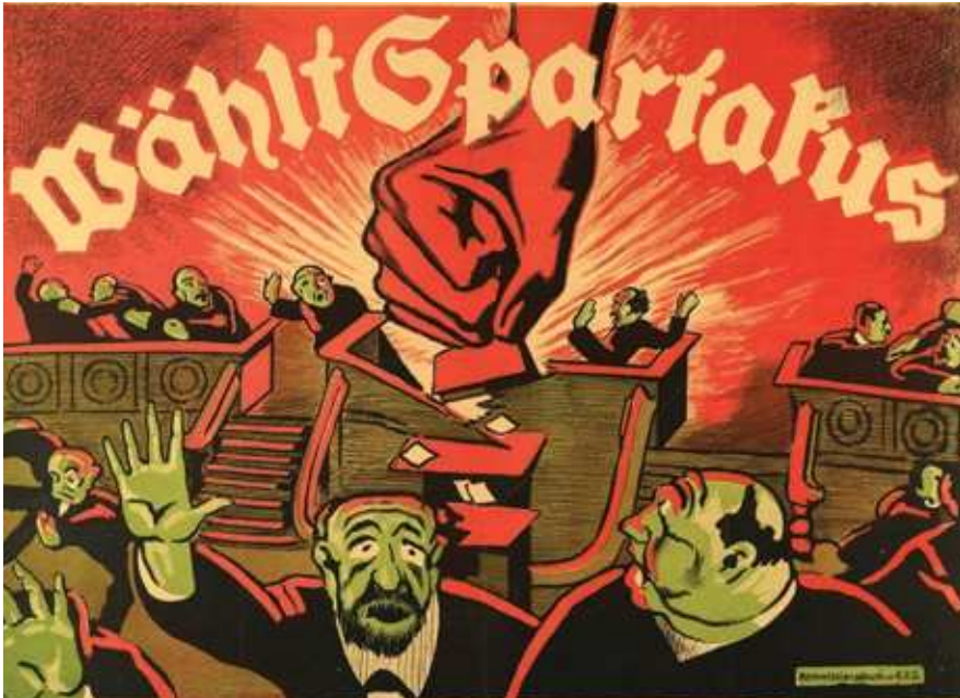
Abb. 12: »Wählt Spartakus«, Plakatlithografie von Karl Jakob Hirsch, 1920

Zu solchen unverhüllten Aufrufen zum Mord, die in dieser Konkrektion sicherlich die Ausnahme blieben, trat vielfach eine Bildsprache, die sich eines ganzen Repertoires gewaltsamer Motive bediente und damit auf mehr oder weniger verklausulierte Weise ebenfalls zur Anwendung von Gewalt aufrief. Die drei folgenden Beispiele aus der frühen, mittleren und Spätzeit der Republik mögen dies illustrieren: