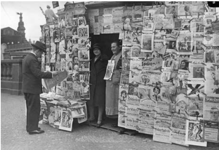
Abb. 7: Berliner Zeitungskiosk, 1928

Die Modernität der Weimarer Republik bestand nicht zuletzt darin, dass wir es hier zum ersten Mal mit einer modernen Mediengesellschaft zu tun haben. Täglich wurden zwölf Millionen Zeitungen verkauft, hinzu kamen noch acht Millionen Wochenblätter; 1932 teilten sich 3732 Tageszeitungen und 7652 Zeitschriften den Markt. 35