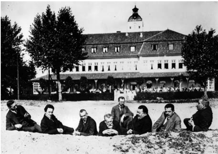
Abb. 2: Friedrich Ebert (3. v. r.) am 16. Juli 1919 mit Gustav Noske (ganz rechts) und Begleitern am Strand von Haffkrug

Am 16. Juli 1919 hielt sich der Reichspräsident in Begleitung des Reichswehrministers Gustav Noske und anderer im Ostseebadeort Haffkrug bei Travemünde auf. Dort besichtigten die Politiker ein Kinderheim und begaben sich dann zum Strand, wo sie sich in staatsmännischer Kleidung in den Sand setzten.