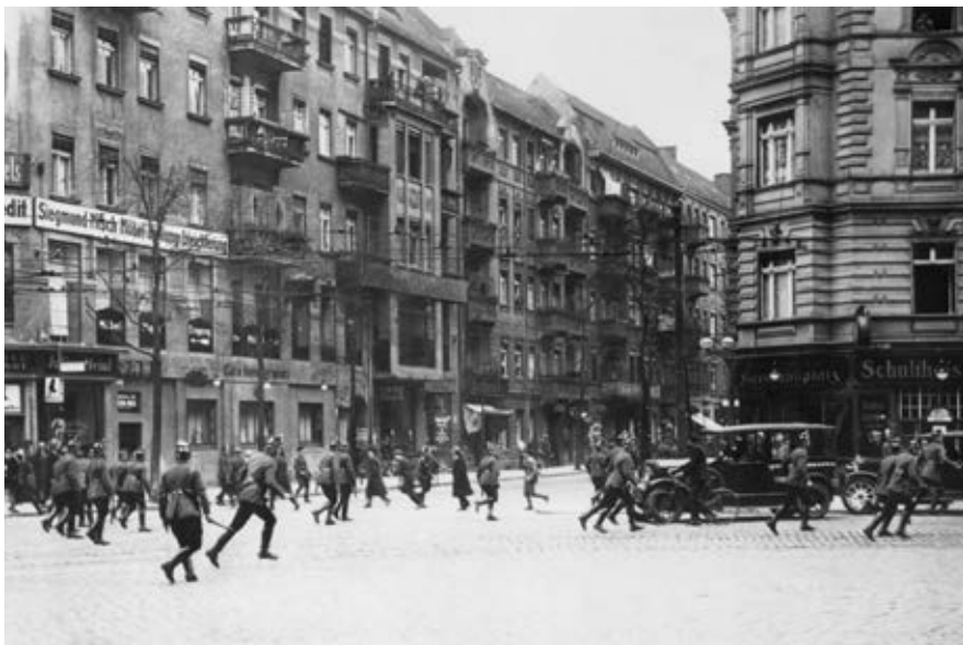
Abb. 11: Polizeieinsatz am Hermannplatz in Berlin-Neukölln, 1. Mai 1929

»lumpenproletarischen« Milieus im Wedding und in Neukölln beteiligten, nicht abreißen wollten, als die Polizisten beschimpft, Hindernisse auf die Straßen geworfen und vereinzelt Barrikaden errichtet wurden, eskalierte die Situation weiter. Nun ging die Polizei gewaltsam gegen Demonstranten wie Zuschauer gleichermaßen vor, setzte »Spritzkommandos« und Panzerwagen ein und veranstaltete, wie die Frankfurter Zeitung berichtete, im Berliner Stadtteil Neukölln regelrechte Treibjagden. Am Nachmittag setzte sie erstmals gepanzerte Fahrzeuge mit Maschinengewehren ein und nahm im Berliner Wedding und in Neukölln ganze Wohngebäude unter Beschuss, an denen die rote Fahne hing; eine Reihe von Todesopfern und Verletzten auch unter gänzlich Unbeteiligten waren die Folge. Während sich die sozialdemokratische und kommunistische Presse gegenseitig der »Blutschuld« bezichtigte, folgten am 2. Mai 1929 mehrere tausend Menschen dem Aufruf der KPD zu einem Massenstreik, bei dem es erneut zu zahlreichen Festnahmen kam. Als auch am 3. Mai die Kämpfe andauerten, verhängte Zörgiebel, der in Babylon Berlin manch prominenten Auftritt hat, ein nächtliches »Verkehrs- und Lichtverbot«: Während einer strengen Ausgangssperre durften Fenster auf der Straßenseite nicht beleuchtet werden, der Verkehr musste in den umkämpften Straßenzügen ruhen.