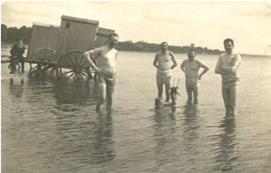
Abb. 3: Friedrich Ebert (2. v. r.) mit Gustav Noske (3. v. r.) und Begleitern am 16. Juli 1919 beim Baden am Strand von Haffkrug