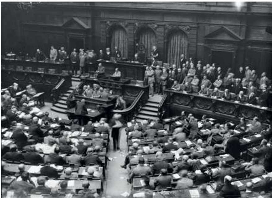
Abb. 21: Die Eröffnungssitzung des Reichstags in Berlin am 27. Mai 1924

Es wäre indessen verfehlt, die Weimarer Demokratie zu idealisieren und zeitgenössische Einschätzungen von der »demokratischsten Demokratie der Welt« (so der sozialdemokratische Innenminister Eduard David 1919) einfach fortzuschreiben. 118 Denn zum einen verhinderten die ebenso scharfen wie permanenten ökonomischen Verteilungskämpfe die Ausbildung