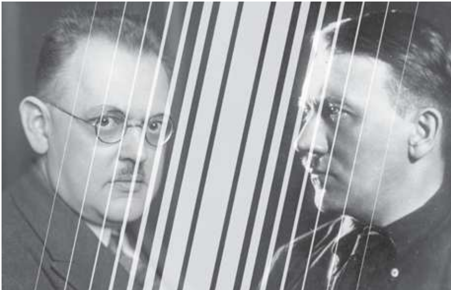
Abb. 9: Reichskanzler Hermann Müller (1928–1930) und Adolf Hitler (1933–1945)

Schon drei Tage nach Müllers Rücktritt bestellte Reichspräsident von Hindenburg den Zentrumspolitiker Heinrich Brüning zum neuen Reichskanzler. Dieser regierte fortan mit einem bürgerlichen Kabinett der rechten Mit-