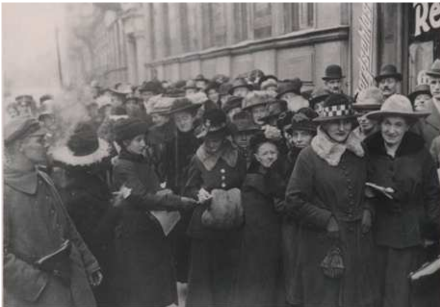
Abb. 20: Frauen vor einem Wahllokal in Berlin bei den Wahlen zur verfassunggebenden Nationalversammlung am 19. Januar 1919

Auch der viel gescholtene Weimarer Parlamentarismus, das parlamentarische Leben, bestand nicht nur aus Beschimpfungen, Blockaden und Polarisierung. 117 Die rund 600 Parlamentarierinnen und Parlamentarier, die nach einem reinen Verhältniswahlrecht in den Deutschen Reichstag gewählt