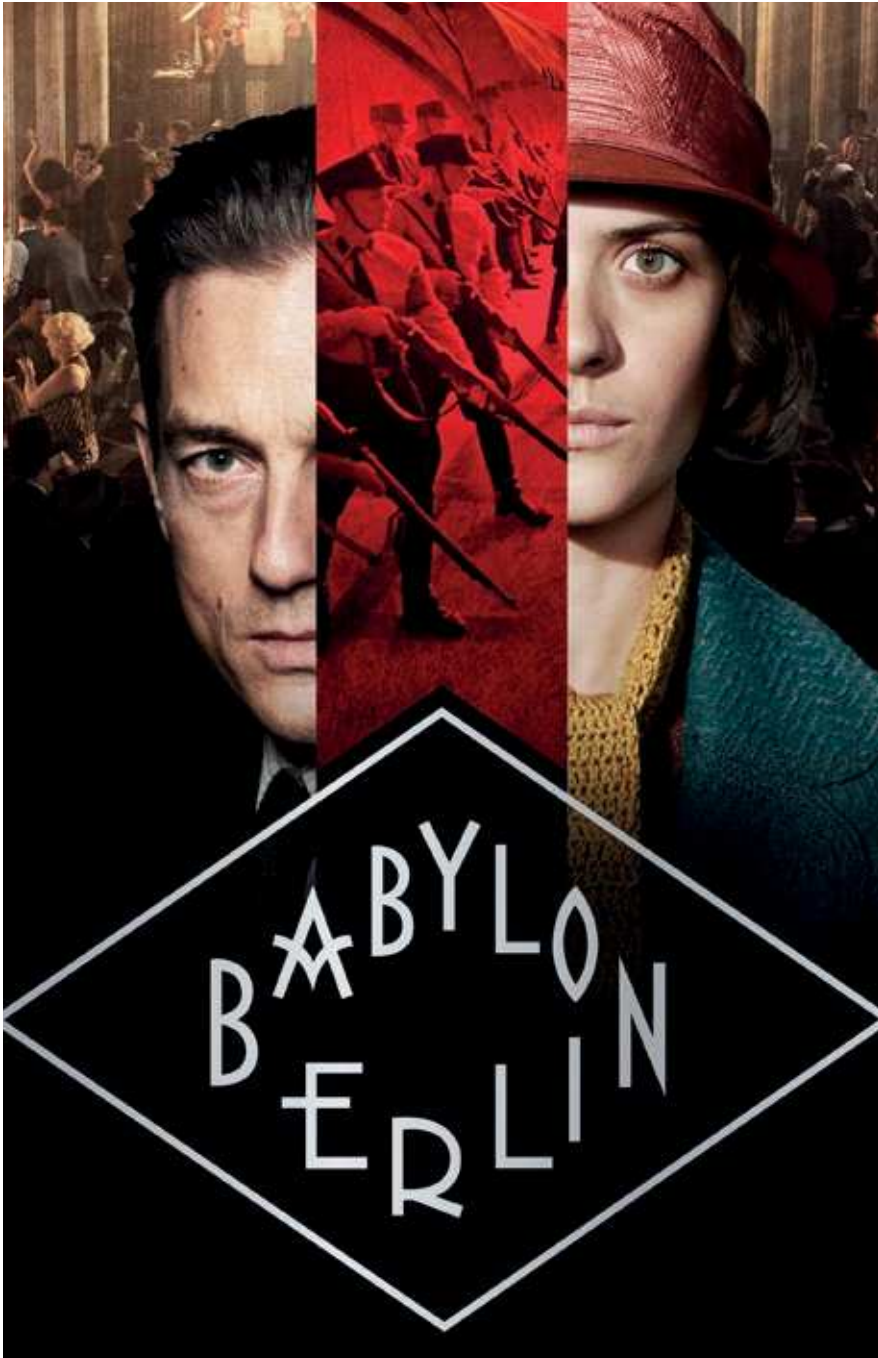
Abb. 1: Poster zur vierten Staffel der Serie »Babylon Berlin«