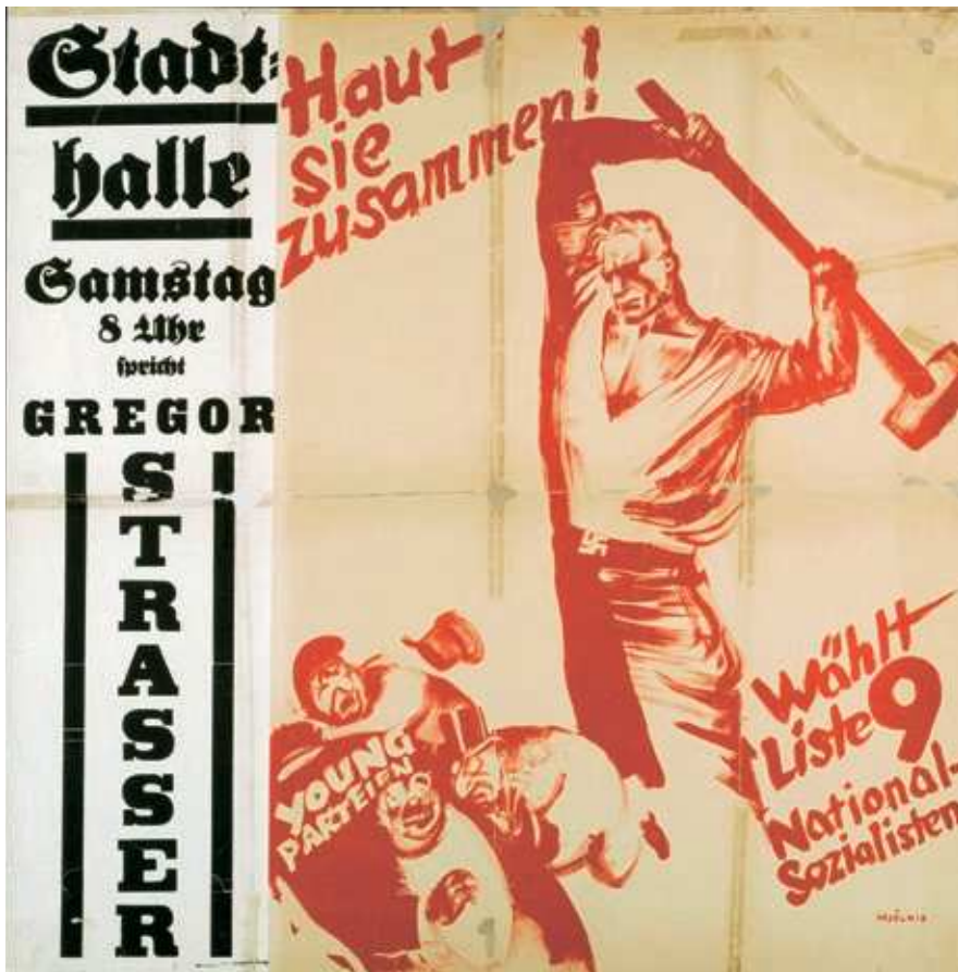
Abb. 14: »Haut sie zusammen!« Plakatgrafik von Hans Herbert Schweitzer, 1930

Alle drei Grafiken dienten als Wahlpropaganda im Vorfeld der Reichstagswahlen von 1920, 1928 und 1930 und legen in diesem Zusammenhang zunächst eine metaphorische Deutung nahe: Sie rufen dazu auf, den politischen Gegner an der Wahlurne zu »schlagen«. Einschlägig ideologisierte Betrachter mochten die Graphiken in ihrem evidenten Gewaltpotenzial, das die Zerstörung des politischen Gegners in aller Deutlichkeit vor Augen führt, allerdings sehr wohl als klare Appelle zur Ausübung physischer Gewalt an bestimmten Personen oder Personengruppen verstehen. Den institutionalisierten Verfahren der demokratischen Wahl und parlamentarischen Deliberation, die in geschlossenen Räumen klar definierten Regeln gehorchen, stellt diese Form der Gewaltpropaganda den offenen Raum der