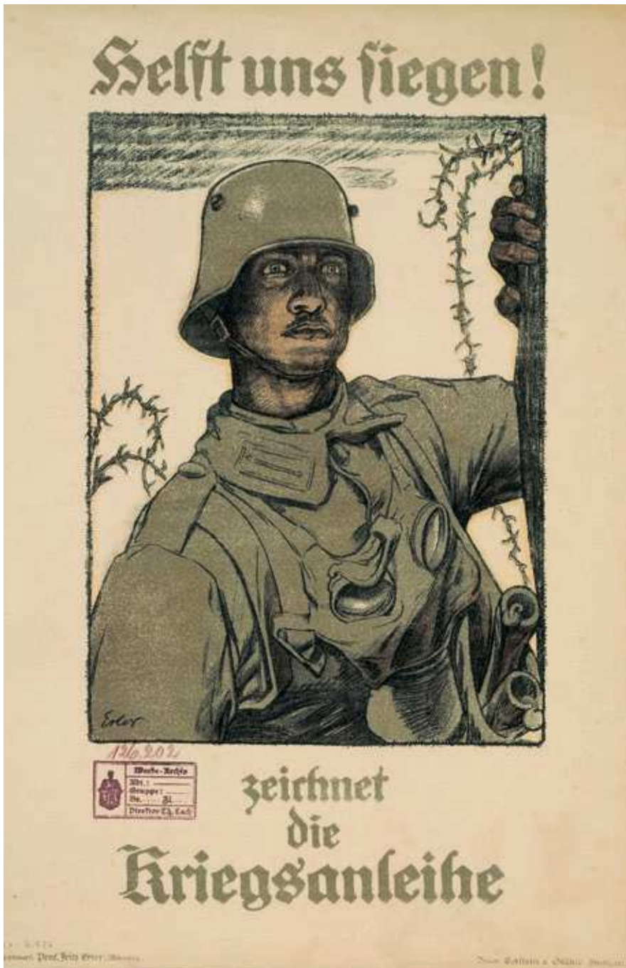
Abb. 16: »Helft uns siegen! Zeichnet die Kriegsanleihe«. Plakatgrafik von Fritz Erlor, 1917