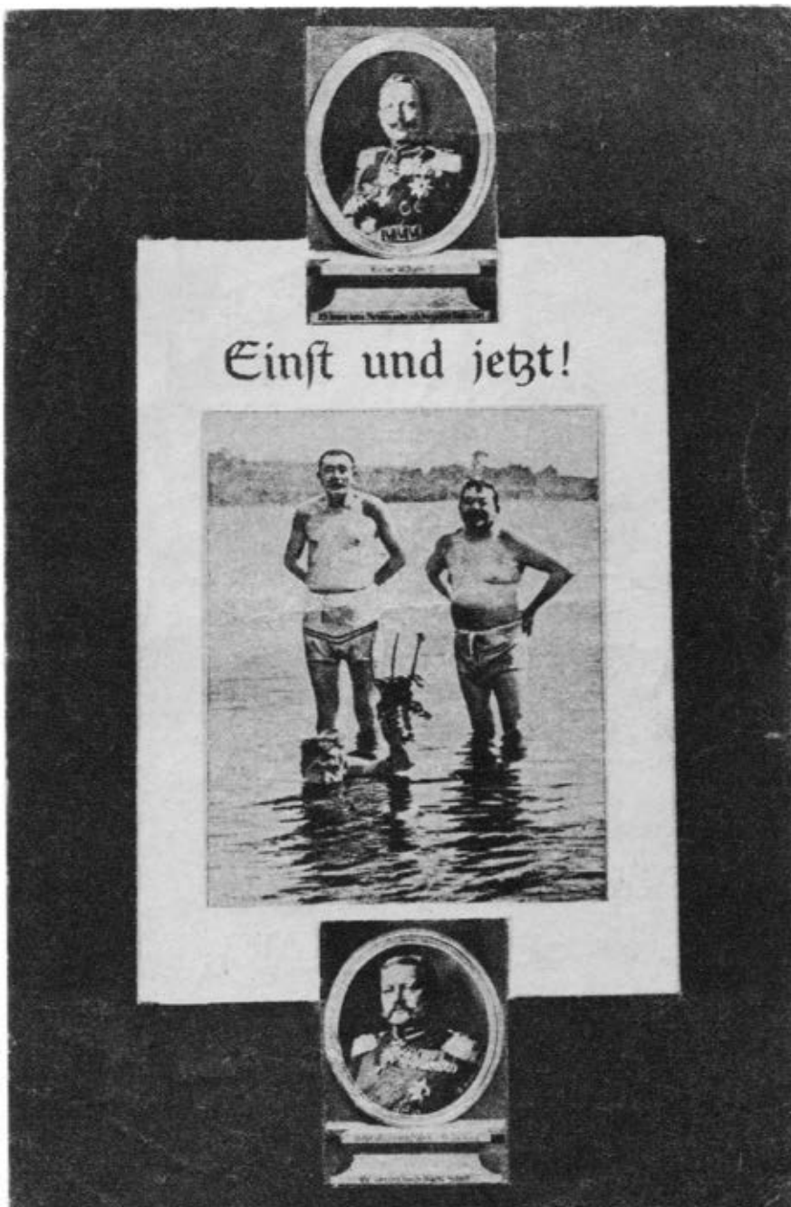
Abb. 6: Bildpostkarte »Einst und jetzt!« (undatiert), veröffentlicht von der Deutschen Tageszeitung im September 1919