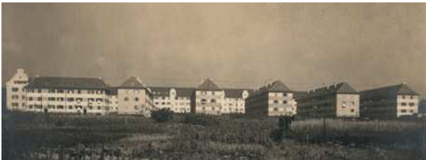
Abb.23: Die Hallschlag-Siedlung in Stuttgart, um 1927

Sozialstaat. Als Sozialstaat hat die Weimarer Republik ihre besonderen Verdienste. 126 Auf die Wiedereingliederung von Millionen von Soldaten wurde bereits hingewiesen. Das zersplitterte und völlig unzureichende Fürsorgewesen für Arme hat die Republik grundlegend reformiert und in ein neues System der sozialen Fürsorge überführt. An den kommunalen Wohlfahrtsämtern arbeiteten fortan professionelle Fürsorgerinnen und Fürsorger (heute: Sozialpädagoginnen und Sozialpädagogen). 127 Dank ausländischer Kredite und einer neu eingeführten »Hauszinssteuer« florierte der öffentliche Wohnungsbau. Kommunen und Genossenschaften bauten zwischen 1924 und 1930 mit staatlicher Förderung 560.000 Wohnungen: 128 Fast jede größere deutsche Stadt verfügt heute über Wohnkolonien aus der Weima-