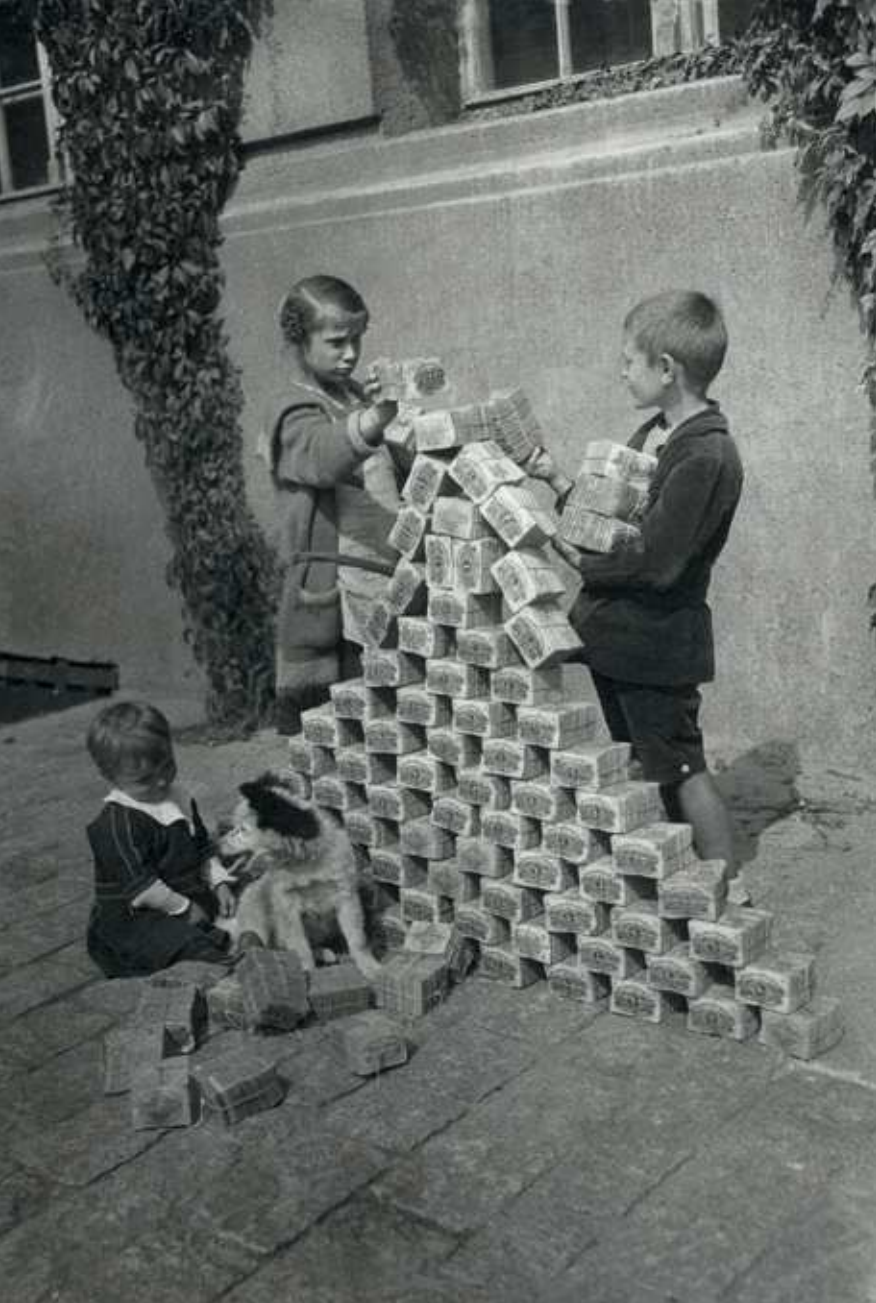
Abb. 15: Kinder spielen mit Bündeln von Geldscheinen, 15.11.1923