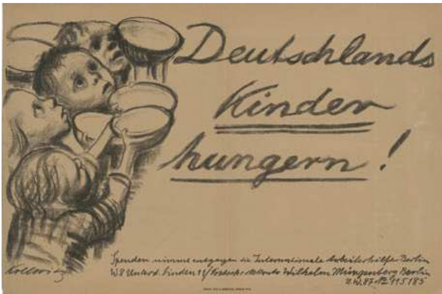
Abb. 17: Deutschlands Kinder hungern! Kreidelithografie von Käthe Kollwitz, 1923

Da die Regierung abermals die Preise für Lebensmittel deckelte, hielten die Bauern ihre Erträge zurück, statt sie für wertloses Geld zu verkaufen. Deshalb standen manche Städte im Herbst 1923 trotz einer guten Ernte am Rande einer Hungersnot. Zuweilen waren die Engpässe so groß, dass Städter aufs Land zogen, um Felddiebstahl zu begehen; Läden wurden geplündert. Während in Berlin die Suppenküchen amerikanischer Quäker