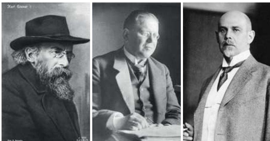
Abb. 10a–c: Kurt Eisner (1867–1919), Matthias Erzberger (1875–1921), Walther Rathenau (1867–1922)