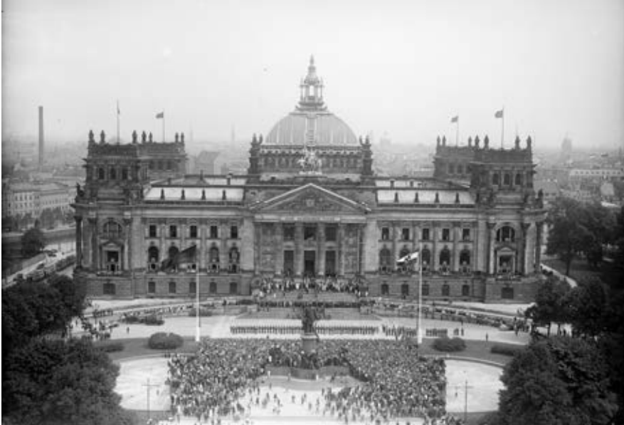
Abb. 19: Der Reichsverfassungsfeier auf dem Platz der Republik in Berlin am 11. August 1926

war als die bloße Vorgeschichte des »Dritten Reichs« oder die pädagogisch leicht instrumentalisierbare Negativfolie zur erfolgreichen Demokratie der Bundesrepublik. 114 Vor diesem Hintergrund sollen für die letzte Lektion, die ich hier entwickeln möchte, einige Leistungen der ersten deutschen Demokratie in fünf Schlaglichtern knapp benannt werden.