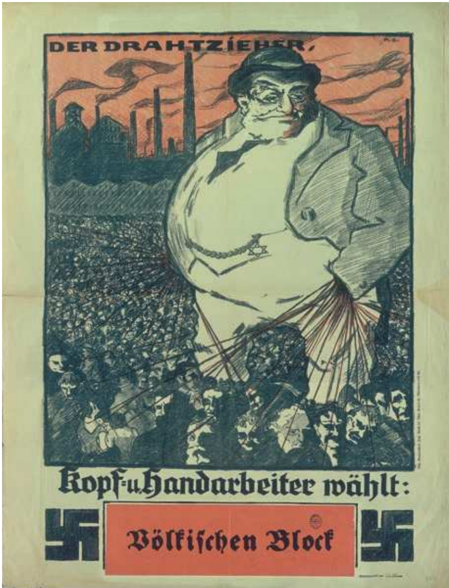
Abb. 18: Wahlplakat des Völkisch-Sozialen Blocks, 1924

Die Stunde der Populisten, so könnte man aus heutiger Perspektive argumentieren, schlägt dann, wenn erstens das Parteiensystem nicht mehr integrierend wirkt, sondern im Gegenteil bestehende gesellschaftliche Prozesse der Desintegration verstärkt, und zweitens aufgrund ökonomischer