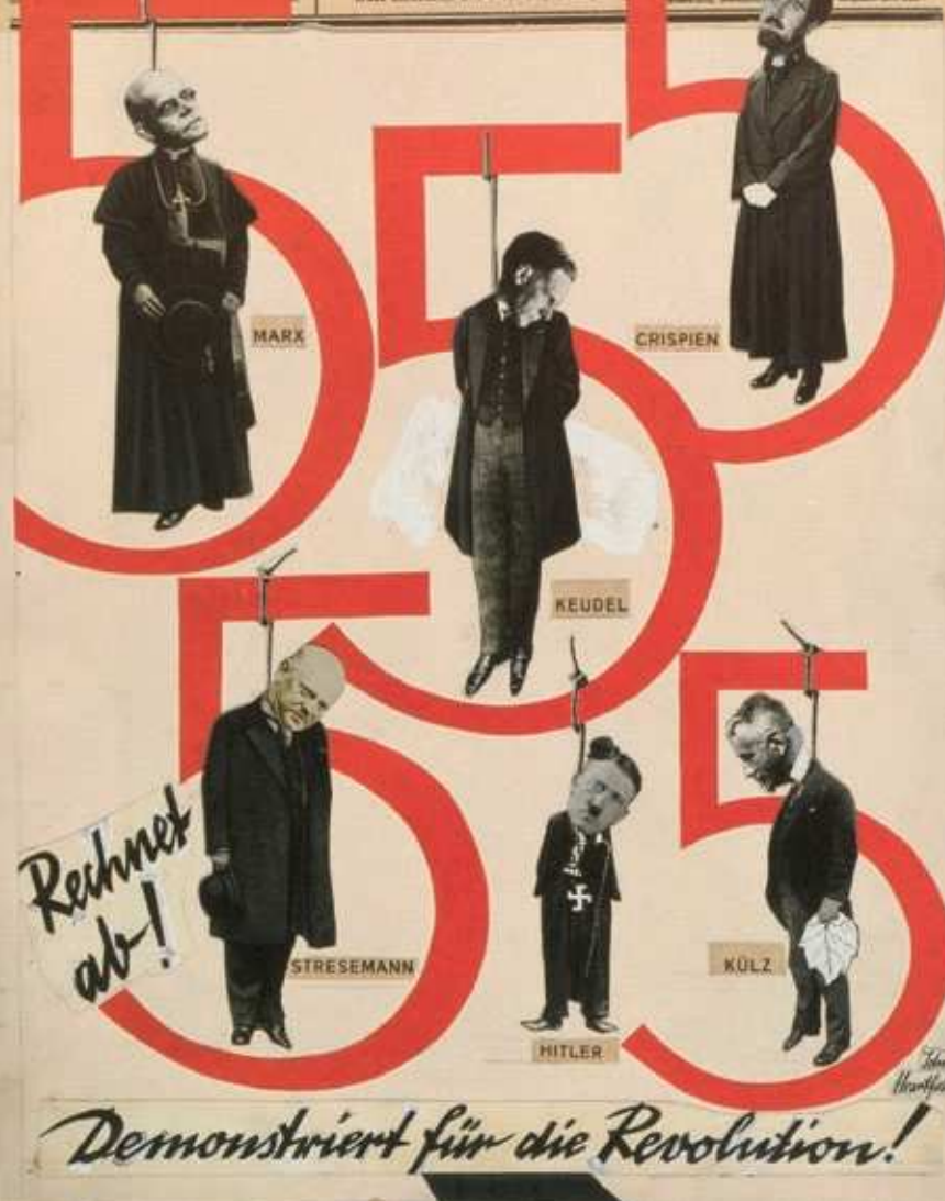
Abb. 13: Titelseite der »Roten Fahne« vom 20. Mai 1928, Grafik von John Heartfield

Redaktion: Berlin, Unter den Eichen 10, 1. Stock. Telefon: 20 20 20. Telegramm: 20 20 20. Postfach: 20 20 20.