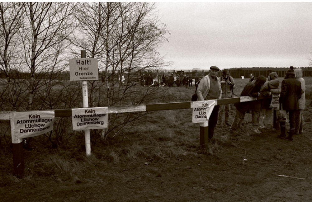
04 – Demonstration an der innerdeutschen Grenze bei Gorleben (1982)