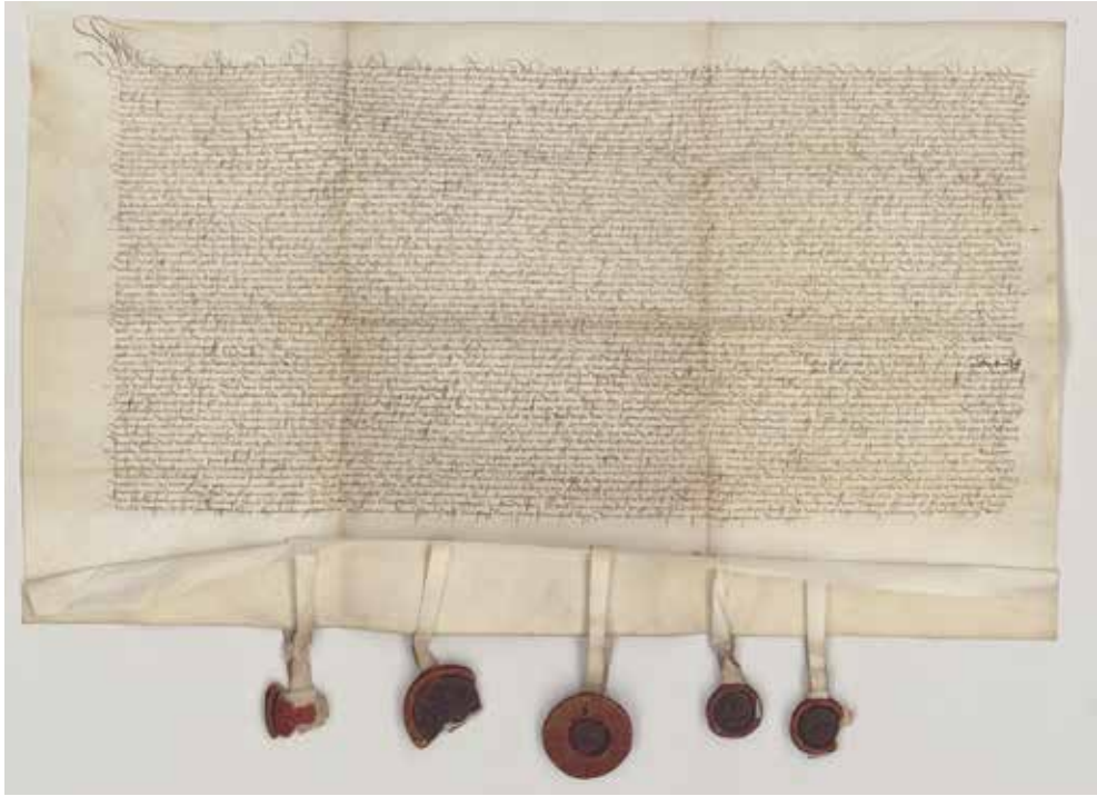
Abb. 2: Urkunde Kurfürst Philipps vom 5. Oktober 1490, mit der er die Übernahme der Schulden erklärt. Darin inseriert die Übertragung Pfalzgraf Ottos vom Vortag.

seine Besitzungen in Bayern ( alle vnd igliche vnser landt, landtschafft, lute, sloß, stette, merckt, dorff, wylere im lande zu Beyern gelegen, so wir itzunt haben oder hernach bekommen mochten, leben, eigen vnd pfantschafft ) mit allen zugehörigen Einkünften und Rechten, Obrigkeiten und Gerichten, Burgleuten, Mannschaften und Klostersvogteien, jedoch behielt er sich ein lebenslanges Nutzungs- und Regierungsrecht vor ( doch vns herin vorbehalten der nyssung, gebruch vnd regierung derselben vnser leben lang vnd nit lenger ). Mit Land und Herrschaft sollten auch die diese betreffenden Unterlagen ( mit allen briefen, registern, zinsbuchern vnd rodeln, darober sagend, die wir han ) in Philipps Eigentum übergehen. Die Übertragung an Philipp und seine lehenserben als vnsern lieben vettern nestgesipten von gebludte, namen vnd stammen beinhaltete ausdrücklich auch alle Lehen, die Otto als Lehenmann des Reichs, der Krone Böhmen und anderer Lehenherren innehatte; jedoch behielt er sich vor, alle geistlichen und weltlichen Lehen bis an sein Lebensende selbst zu verleihen und Philipp ein Verzeichnis dieser Lehen zukommen zu lassen. Otto versprach, sich dafür einzusetzen und bei den jeweiligen Lehenherren nach allem flisse zu erwirken,