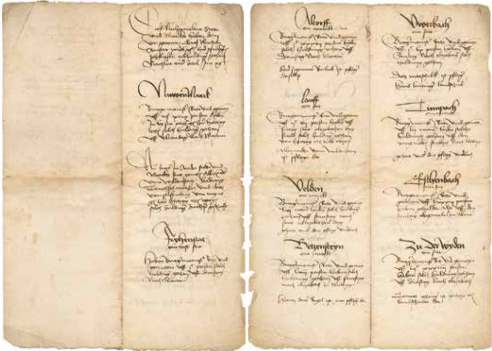
Abb. 3: Auflistung der huldigenden Städte im Huldigungsregister von 1490.

tend sein Viztum Michael von Wertheim im Winter 1490/91 absolvierte. Das bereits zitierte Huldigungsregister listet in einem zweiten Abschnitt die Städte und Märkte auf, die Graf Michael von Wertheim anstatt Kurfürst Philipp erbhuldung gethan nach lut einer zettel . 66 Wie beim Schwören der Amtleute diente auch beim Huldigungseid in den Kommunen ein Zettel mit der Eidesformel als Vorlage zum Nachsprechen. Festgehalten wurde jeweils, dass Bürgermeister, Rat und Gemein womit die versammelte Bürgerschaft gemeint ist, solch huldung gethan oder gehuldet haben, mit der zusätzlichen Angabe der Anzahl der person , die den Eid leisteten. Welche Personen – außer Bürgermeister und Rat als Regiment und Repräsentanten der Kommunen – tatsächlich aufgefor-