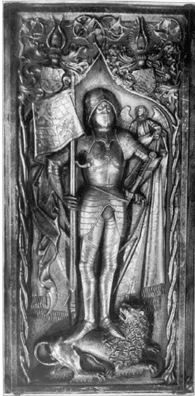
Abb. 4: Tumba Pfalzgraf Ottos II. in der Neumarkter Hofkirche. Vorlage: Friedrich Hermann Hofmann und Felix Mader: Stadt und Bezirksamt Neumarkt (Die Kunstdenkmäler des Königreichs Bayern. Regierungsbezirk Oberpfalz und Regensburg XVII). München 1909. Tafel I.

dert waren zu huldigen, wird nicht spezifiziert. Jedoch ist davon auszugehen, dass nur die Hausväter, eventuell auch Witwen als Hausvorstände oder sogar nur Bürger, also Bewohner, die das Bürgerrecht besaßen, zum Eid zugelassen waren. 67